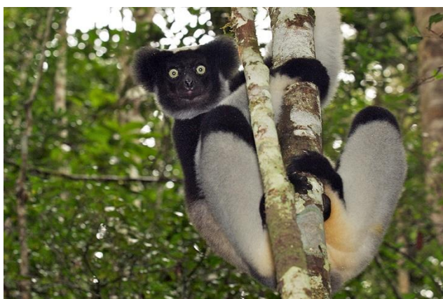
De grote indri-indri

Het park bestaat uit vochtig woud en is heuvelachtig. Hier zitten 11 soorten lemuren. We gaan ze wel niet alle elf zien, maar de meest spectaculaire is wel de indri-indri, de grootste van alle lemuren, en met wat geluk de wit-zwarte Vari.