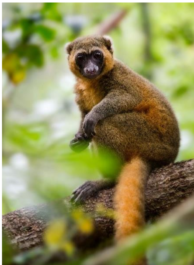
Gouden bamboe lemuur

In totaal zijn er een 12 lemuursoorten, waarvan er 5 nocturne (nachtdieren) zijn. Ook heel wat vogels zijn hier te spotten, zoals de paradijsvliegenvanger, en uiteraard reptielen en amfibieën.