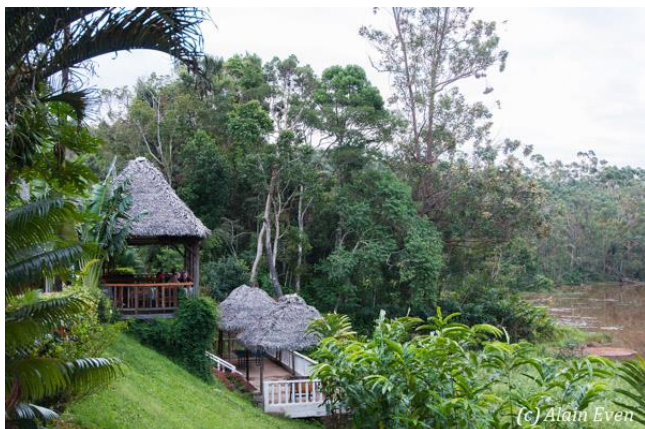
Ligging van de chalets