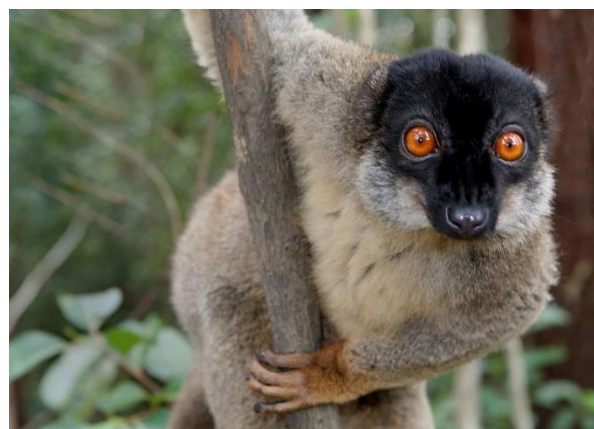
De bruine lemuur

's Ochtends maken we een wandeling in het Analamazaotra reserve speciale. Dit is maar 800 hectare groot, maar grenst aan het veel grotere Andasibe-Mantadia Nat Park. Het is speciaal ingericht voor de vele toeristen te kunnen ontvangen, zonder dat het hele park verstoord wordt.